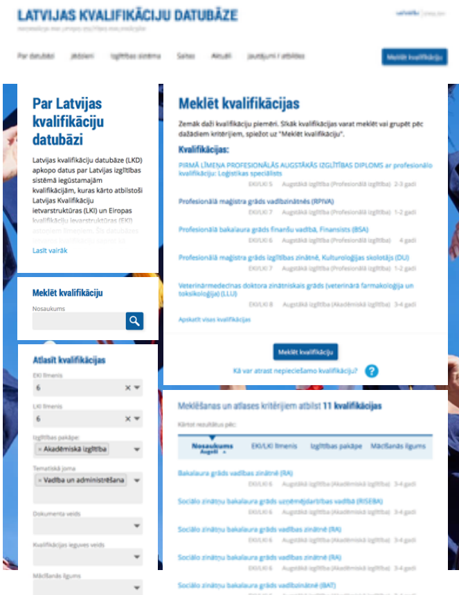
Datubāzes mājaslapas attēls

Terminu skaidrojošā vārdnīca Ikvienam pieejami skaidrojumi biežāk lietotajiem jēdzieniem.